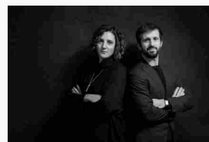
Zucon International Project unico yacht designer tra i 50 top studi di architettura