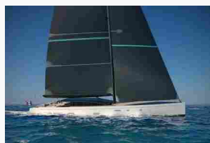
Perini Navi annuncia la vendita del secondo 42 metri E-volution