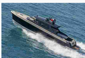
Nauta ha varato Tender 48 costruito da Maxi Dolphin.