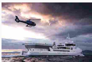
Damen consegna Game Changer