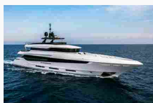
Ancora una vendita per Mangusta Yachts